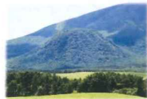
写真1 天丸山からの風景の一部の小浅間山。約2万年前に粘り気の高い流紋岩質マグマが噴出して生じた溶岩ドーム。

浅間牧場といえば天丸山からの雄大な景色を思い浮かべる方もいるかもしれませんが(写真1)。最近、天丸山の周辺で地質調査を行ったところ、地表下5メートルほどの黒色土壌中から微細な火山ガラスの粒子(アカホヤ火山灰)が見つかりました(写真2)。これは屋久島の北方の海底火山(鬼界カルデラ)で7300年前頃に巨大噴火が起きて、東北地方に及ぶ広範囲に降灰があった時のものです。浅間山麓でも、約1000キロメートルもの遠方から飛来したキラキラ光る火山灰を目撃した縄文人がいたのかもしれませんが。今回アカホヤ火山灰の上下に軽石や火山灰の地層が確認され、浅間火山の縄文時代の活動の手がかりが得られました。広大な浅間牧場の地面の下は、浅間火山の噴火の歴史に関する情報の宝庫といえます。