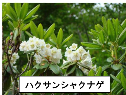
ハクサンシャクナゲ